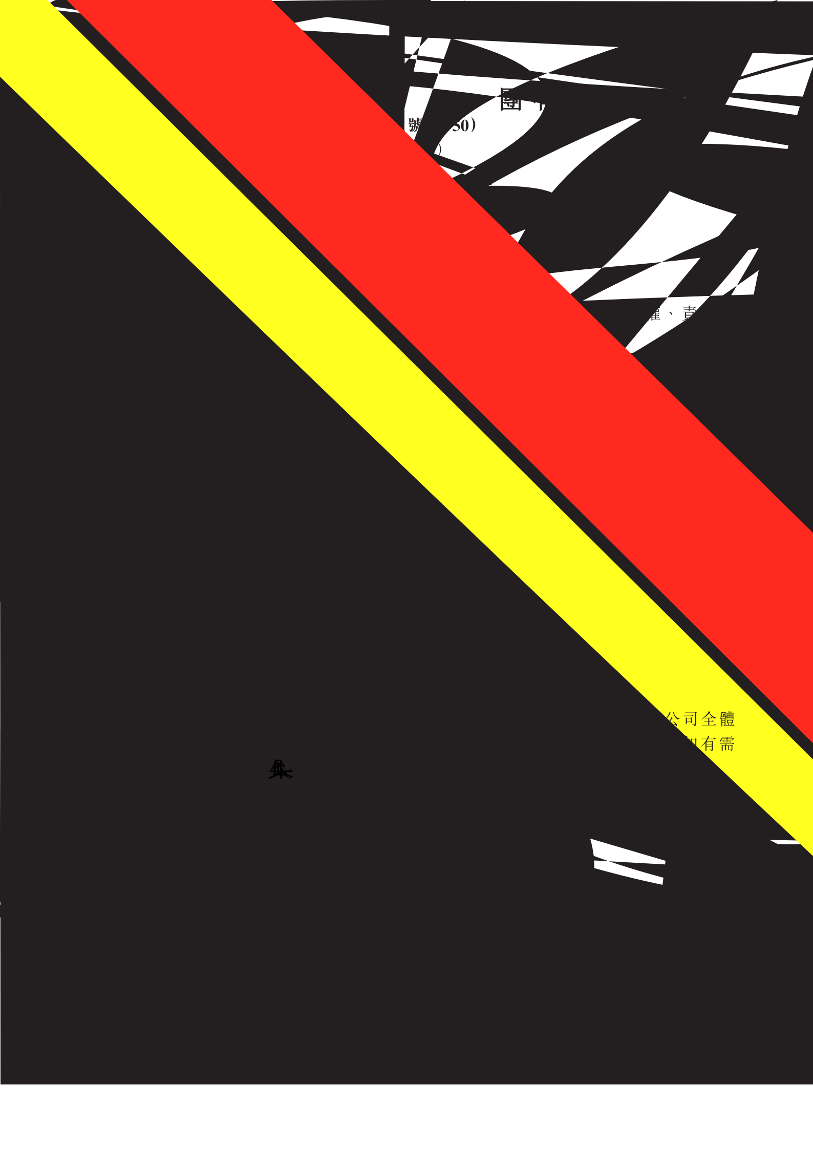
圖 號 (50)